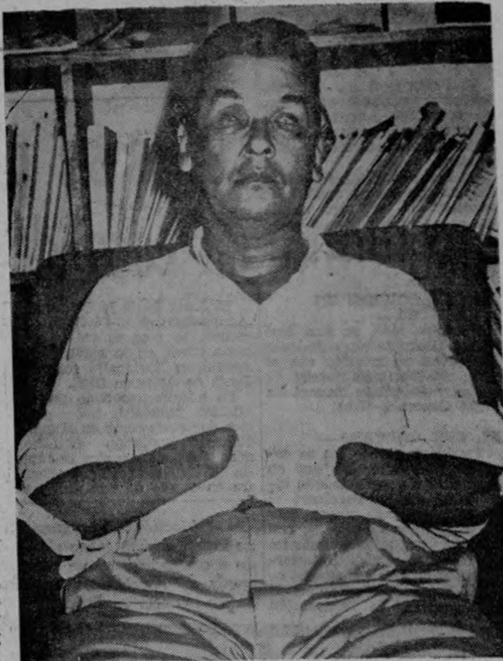
Arriba corazones! Podrán nuestros lectores apreciar la tragedia que vive este hombre. Sin manos y sin ojos, la vida se le hace absoluta y totalmente difícil. Una ayuda económica suya, servirá para mitigarle sus penas

Este hombre, si así puede distinguirse, ya que apenas es un desecho de la vida, está ahora en la mayor miseria. Su familia pasa angustias y hambre. Pide el auxilio econó-