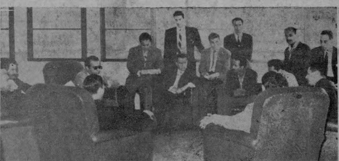
Esta mañana en una Sala de la Asamblea Legislativa se reunieron los diputados con los Ministros de Economía y Hacienda y de Obras Públicas. Allí se hicieron serios cargos contra el Ministro Salas y su Oficial Mayor. Recoge la gráfica de Herradora un momento de esta reunión.—

Admitió Ministro Salas que él ha dicho públicamente que la Asamblea le niega fondos a Obras Públicas y por eso se ha creado el problema de no pago de prestaciones; sobre despidos informa que está reorganizando y hay trabajadores innecesarios.— Oduber hizo duras acusaciones contra el Ministro y Oficial Mayor.